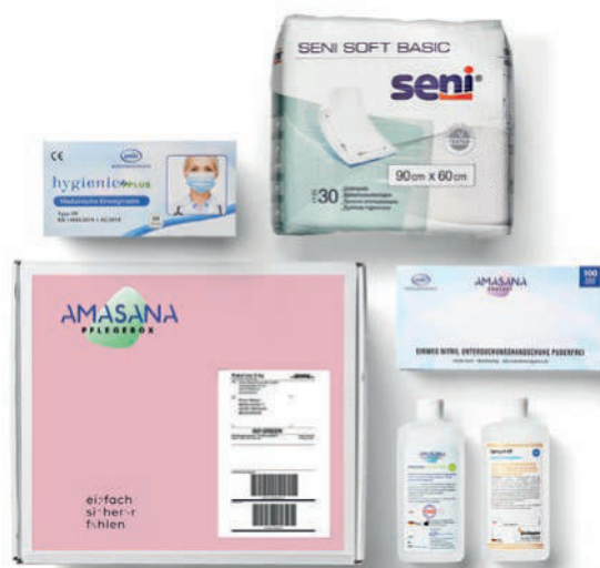
Exemplarische Inhaltsübersicht einer Amasana Pflegebox

Die Amasana Pflegebox kann ohne Rezept in einem kostenfreien und monatlich anpassbaren sowie kundba-