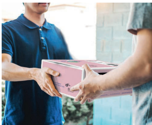
Unkomplizierte Übergabe einer Amasana Pflegebox an der Haustür.

Weiterführende Informationen zur Amasana Pflegebox erhalten Sie telefonisch unter 0208/ 306704 76 sowie im Internet unter www.amasanabox.de .