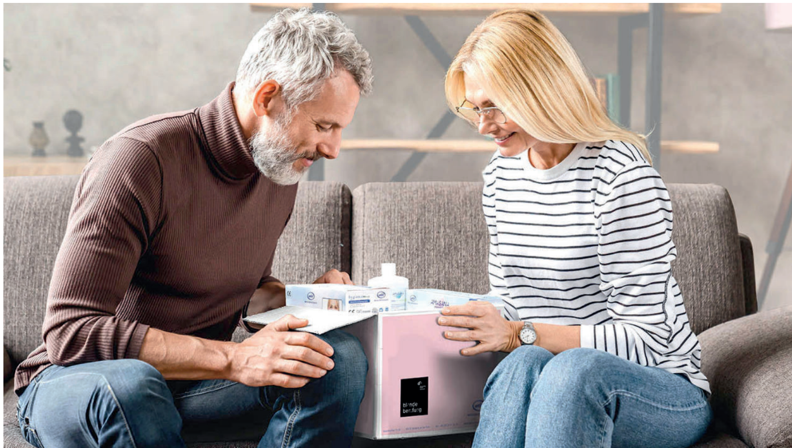
Das Ehepaar überzeugt sich von der hochwertigen Produktauswahl.